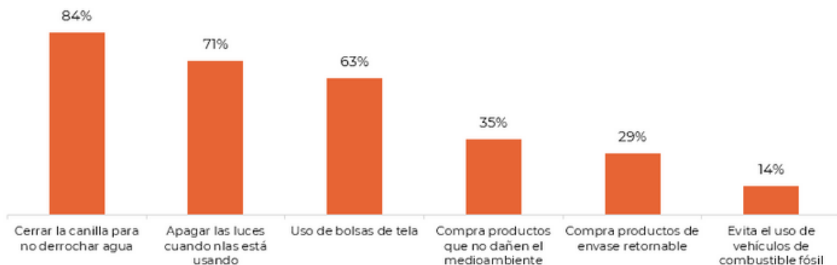
Gráfico 4. Frecuencia de acciones vinculadas al cuidado del ambiente (Suma de porcentajes de "siempre" y "casi siempre")

Pregunta: ¿Con qué frecuencia realizas las siguientes acciones: ...?