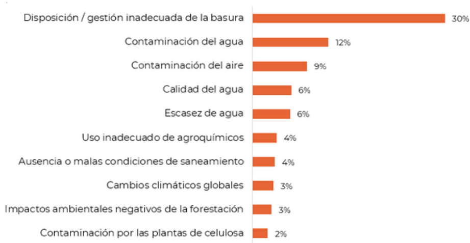
Gráfico 2. Principales problemas ambientales del país

Pregunta: Hablemos para empezar sobre el cuidado del ambiente. Pensando en nuestro país, ¿cuál dirías que es el problema ambiental más importante?